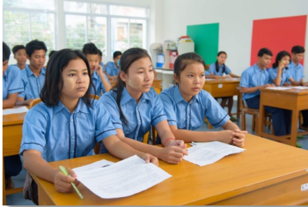
Unterricht in den neuen Klassenzimmern