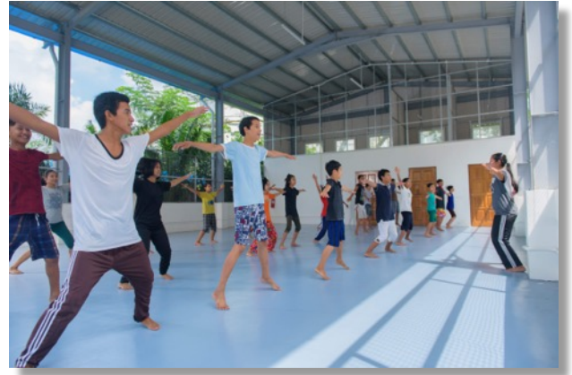
Sport in der neuen Halle

Um einer wachsenden Zahl von Jugendlichen den Zugang zu E4Y zu ermöglichen und die Nachhaltigkeit der Schule zu sichern, haben wir ein Stipendien/Patenschaftsprogramm entwickelt, in dem ein Unterstützer von E4Y die Finanzierung von einer oder mehreren Schüler/innen übernehmen kann. Wir würden uns besonders freuen, wenn Sie als Förderer von E4Y bei der Einführung des Stipendienprogrammes vorangehen könnten, indem sie Stipendien für das laufende Schuljahr oder mehrere Jahre übernehmen. Eine solche Pionierleistung hilft, das Stipendiensystem zu etablieren und schafft damit die Voraussetzung, in Zukunft weit mehr Kindern aus armen Familien den Zugang zum E4Y zu ermöglichen.