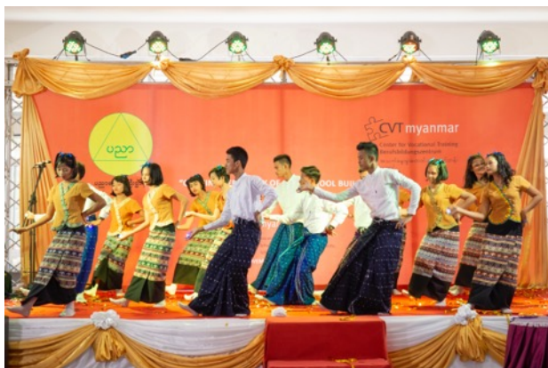
Tanzdarbietung von Schülern bei der festlichen Einweihung