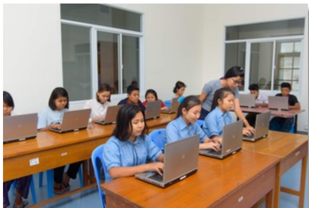
Computerklasse im neuen IT-Raum