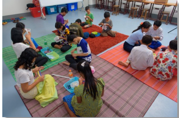
Textiles Werken für Jungen und Mädchen

Für einmal befasst sich der Informationsbrief aus aktuellem Anlass ausschliesslich mit unserem E4Y, unserer vier Jahre dauernden Grundschule (5. bis 8. Klasse) wo Kinder, welche vorwiegend aus finanziellen Gründen ihre Grundschulausbildung vorzeitig abbrechen mussten, eine Chance bekommen, die Ausbildung fort zu setzen und wo sie gezielt auf das spätere Berufsleben vorbereitet werden.