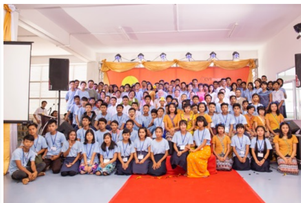
Der Jahrgang 2018-2019