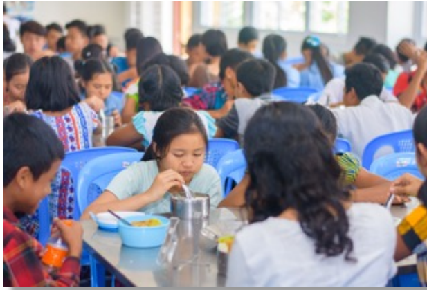
Beim Mittagessen in der Kantine