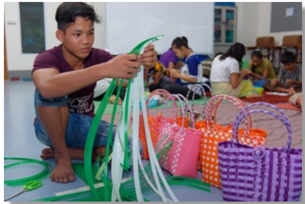
Korbflechten aus Recyclingmaterial