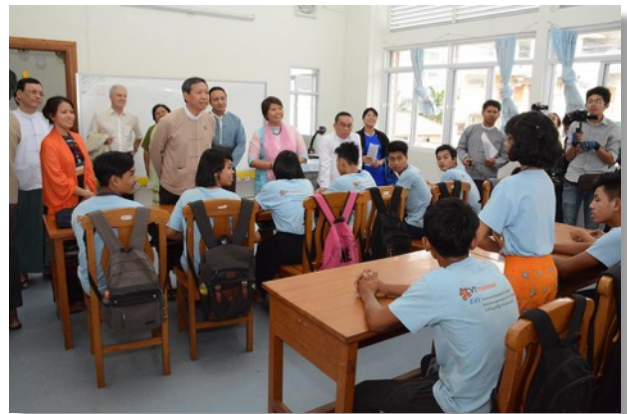
Besuch des Bildungsministers in der Klasse

Das vom Erziehungsministerium zur Verfügung gestellte Gebäude wurde im ersten Halbjahr umfangreich renoviert und bietet heute dem E4Y ideale Bedingungen, um in den kommenden Jahren noch mehr Jugendlichen einen Schulabschluss zu ermöglichen. Im Juni konnte das erste Schuljahr bereits mit 2 Klassen gestartet werden. Insgesamt werden heute über 130 Schüler ausgebildet und das angestrebte Ziel ist eine Verdopplung dieser Zahl in den nächsten Jahren.